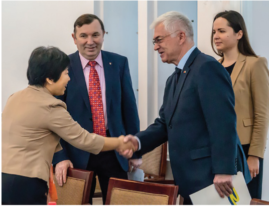
Пан Посол відвідав круглий стіл “Перспективи стратегічного співробітництва між Україною та Китаєм”. Січень, 2016 р.

Mr. Ambassador visited the round-table discussion “Perspectives of strategic cooperation between Ukraine and China”. January 2016