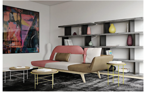
Українські дизайнери й архітектори презентували свої проекти на виставці "Paris Design Week 2017" Ukrainian designers and architects presented their projects during the exhibition Paris Design Week 2017

Лише протягом 2017 та першої половини 2018 років у культурно-інформаційному центрі Посольства було проведено 14 експозицій (фото, живопис, графіка), 11 музичних концертів, багато кінопоказів, презентацій, літературних зустрічей, дефіле мод. Серед найбільш вагомих можна назвати: виставку фотографій українських митців, призерів міжнародних конкурсів, зокрема фотосалону Paris Photo/Plolycories (також проект «.RAW» про боротьбу українців із російською агресією); концерт відомого дуету «Сестри Тельнюк»; презентації перекладів книг А. Куркова, А. Кокотюхи, Я. Мельника, О. Сенцова; зустріч із відомою актрисою й письменницею українського походження Мілен Демонжо з нагоди виходу її графічного роману «Прощавай, Харкове!»; тематичний вечір «Від Анни Ярославни до Шептицького» за участі В. Троїцького тощо. Також започатковано новий формат культурної дипломатії: проведення вечорів і майстер-класів української кухні в рамках волонтерського проекту асоціації «A travers l'Europe», яка організує відпочинок у Франції для дітей-сиріт війни на Сході України. Такий формат надзвичайно сподобався французькій публіці, яка з цікавістю ставиться до кулінарного мистецтва.