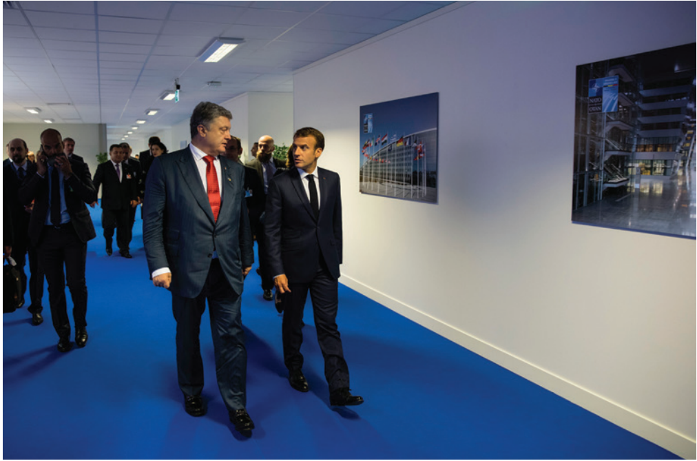
Президенти України Петро Порошенко та Франції Еммануель Макрон на саміті НАТО в Брюсселі. 2018 рік Presidents of Ukraine Petro Poroshenko and France Emmanuel Macron during the NATO Summit in Brussels. 2018

Водночас треба зауважити, що нове керівництво Франції на чолі з Е. Макроном, який першим серед сучасних західноєвропейських лідерів публічно визнав відповідальність Росії за ситуацію на Сході України, продовжує займати сприятливу для нас позицію у протидії російській агресії. Тезу про пряму відповідальність Росії щодо здійснення агресії проти України підтвердив також міністр у справах Європи і закордонних справ Ж.-І. Ле Дріан, перебуваючи в Україні 22–23 березня 2018 року.