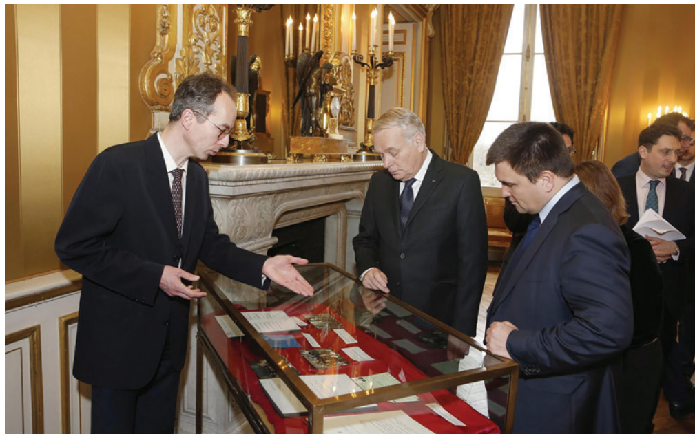
Міністри закордонних України Павло Клімкін та Франції Жан-Марк Еро на відкритті виставки, присвяченій річниці встановлення дипломатичних відносин та 100-річному ювілею від часу заснування української дипломатичної служби. 09.03.2017.

Ministers of Foreign Affairs of Ukraine and France, Pavlo Klimkin and Jean-Marc Ayrault, during the opening of exhibition dedicated to the anniversary of diplomatic relations establishment and centenary of Ukrainian diplomatic service foundation, 09.03.2017.