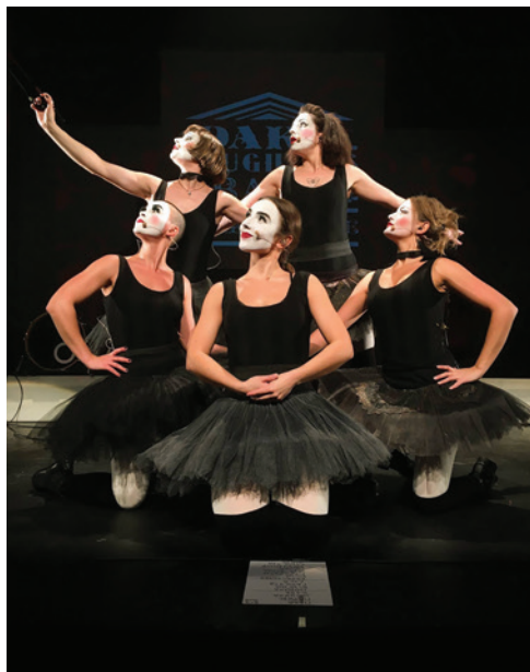
Виступ українського жіночого театральномузичного гурту "Dakh Daughters" у Франції

Симпатії французів назавжди завоювали такі музичні гурти, як «Dakh Daughters», «Dakha Brakha», «Океан Ельзи».