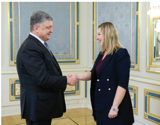
Президент України Петро Порошенко та голова групи дружби «Франція–Україна» Валерія Фор-Мунтян

Україна з великим інтересом вивчає сучасні ініціативи Франції в різних сферах, зокрема екології, енергоефективності тощо. Зі свого боку французькі компанії теж намагаються активно використовувати потенціал України в цих напрямках, долучаючись до амбітних українських екологічних та енергетичних проєктів. Мабуть, найбільш відомим прикладом є реалізація проєкту будівництва об'єкту Укриття-2 ЧАЕС «Арка» із залученням провідного французького інженерного досвіду, що за своїми новаторством та технологічною складністю фахівці порівнюють із дослідженням космосу. Окрім цього, французька компанія EGIS розробляє техніко-економічне обґрунтування (ТЕО) будівництва з переробки твердих побутових відходів у м. Львів, на основі якого компанія ENGIE буде здійснювати будівництво заводу. Ця французька енергетична компанія-гігант висловила свою зацікавленість в реалізації проєкту з будівництва сонячної електростанції в Чорнобильській зоні відчуження та вже здійснила первинне ТЕО.